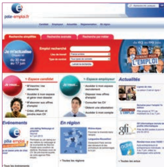
Page d'accueil du site www.pole-emploi.fr

Quelques exemples de CV-thèques : cv.enligne-fr.com , cv.com , cv-theque.fr .